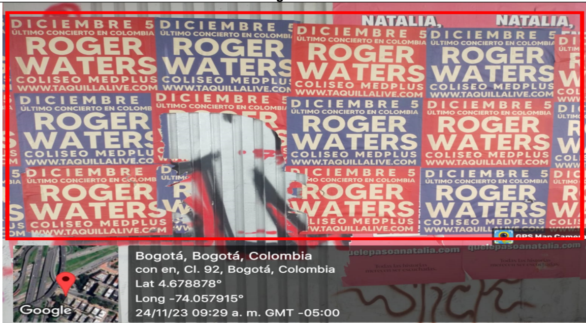
Fotografía No. 6

En la cual se observa el texto de la PEV “DICIEMBRE 5 ÚLTIMO CONCIERTO EN COLOMBIA ROGER WATERS COLISEO MEDPLUS WWW.TAQUILLALIVE.COM ”