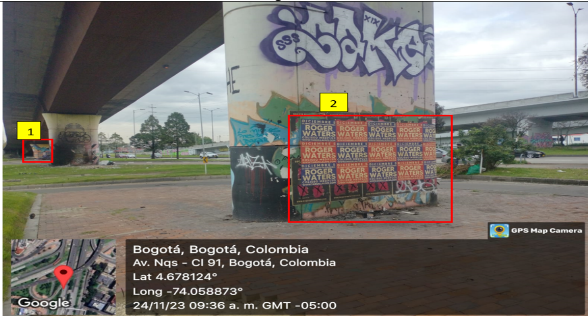
Fotografía No. 5

En la cual se evidencian elementos de publicidad identificados con el número 1 ubicados en la columna del puente vehicular en área que constituye espacio público según georreferenciación de la fotografía ubicado en las coordenadas 4.677976° y 74.059536°, en la localidad de Chapinero.